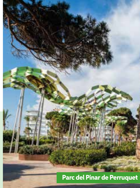
Parc del Pinar de Perruquet