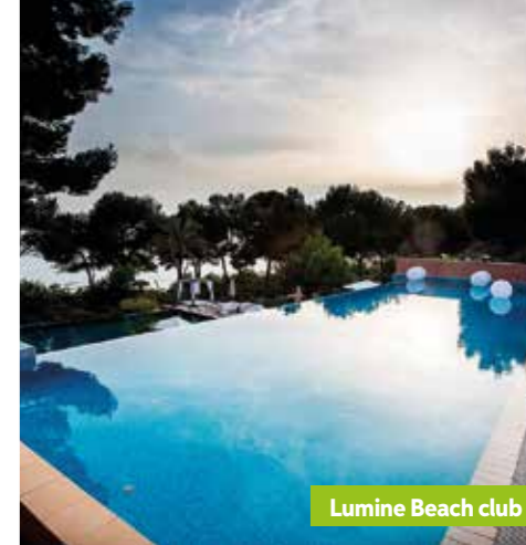
Lumine Beach club

Son design infinity rend possible la fusion de la mer et de l'eau de la piscine avec l'horizon, créant une sensation relaxante unique.