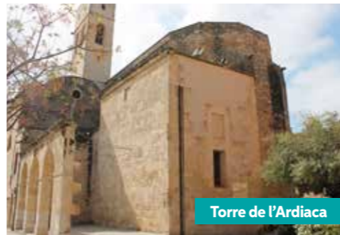
Torre de l'Ardiaca

Déclaré Bien culturel d'intérêt national, ses origines remontent au XII ème siècle. Le château est situé au Nord de la commune, très proche du Celler Noucentista de la Coopérative agricole, et est mis en valeur par sa silhouette svelte enveloppée par une pinède épaisse. Le bâtiment a subi différentes modifications au fil des années donnant naissance à un bâtiment d'aspect néo-médiéval.