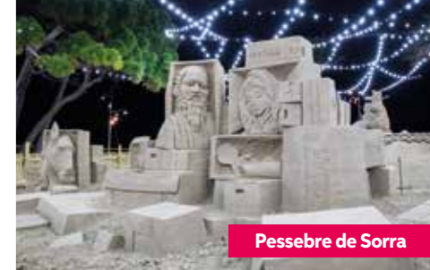
Pessebre de Sorra

Le jardin du Château de Vila-seca reçoit, aux portes de l'été, le "TASTVM, el maridatge de la nostra