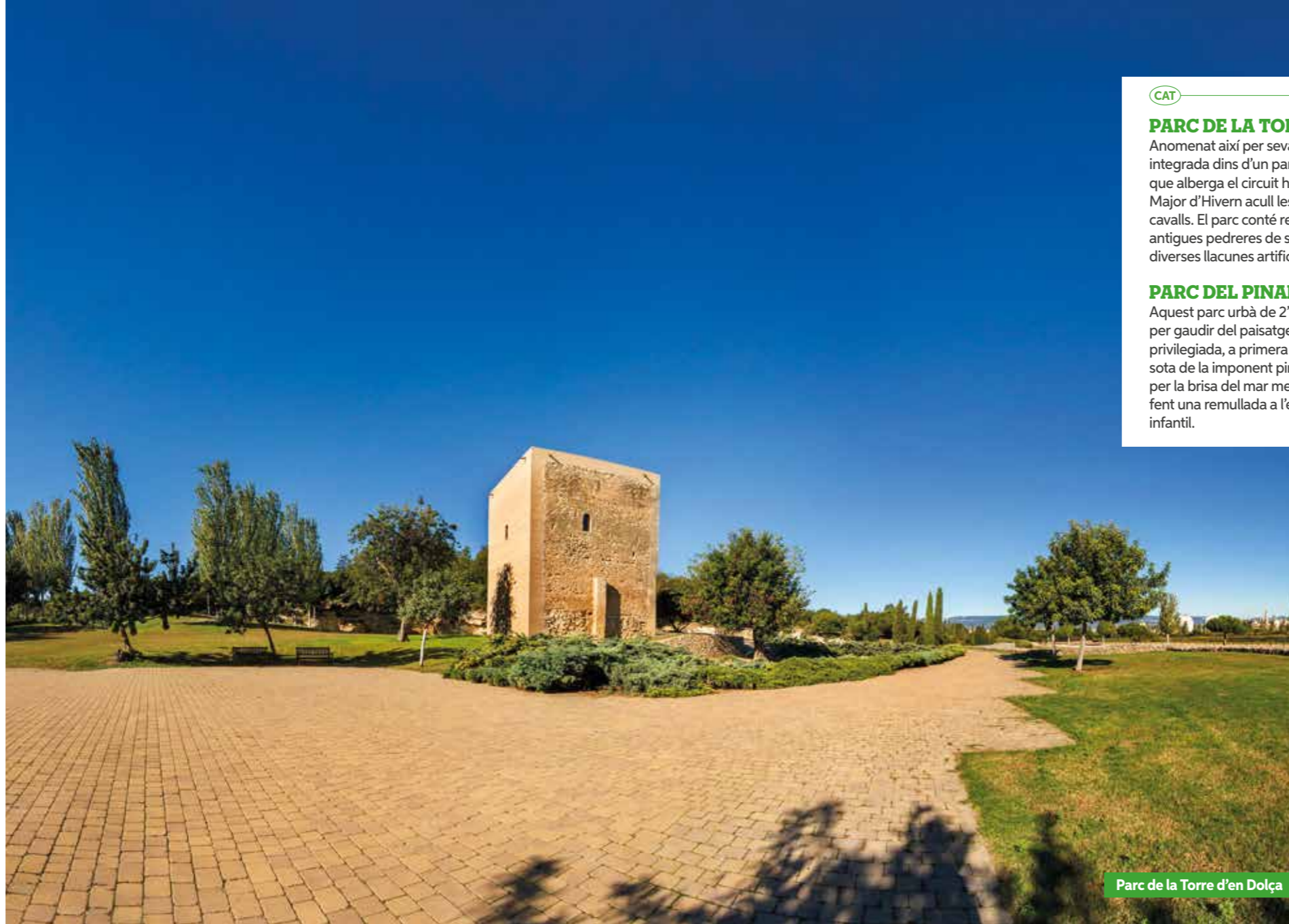
Parc de la Torre d'en Dolça