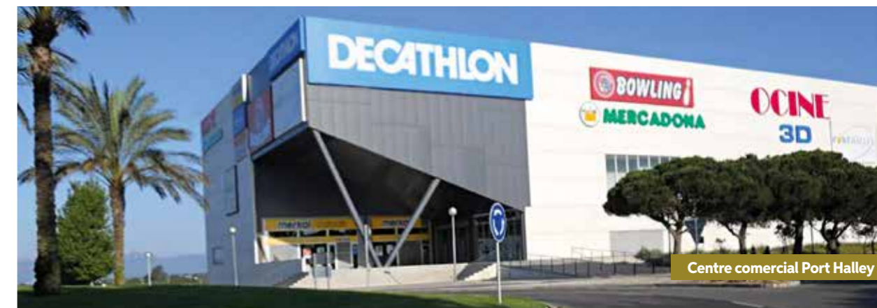
Centre comercial Port Halley

Que vous vouliez tranquillement prendre un verre ou danser aux rythmes du moment, vous trouverez différents espaces de divertissement: chiringuitos que vous trouverez sur la plage et la discothèque Pachá la Pineda, l'une des plus emblématiques de la Costa Daurada.