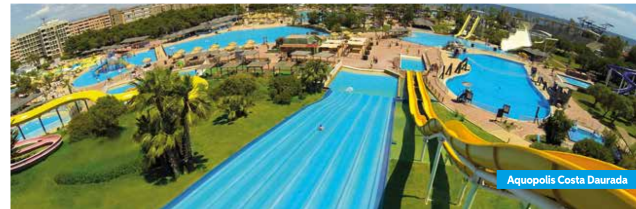
Aquopolis Costa Daurada

C'est le parc aquatique le plus grand de Catalogne et le seul de la Costa Daurada que dispose d'un delphinarium. Vous profiterez du spectacle en famille et pourrez apprendre la manière dont vivent et se comportent ces mammifères.