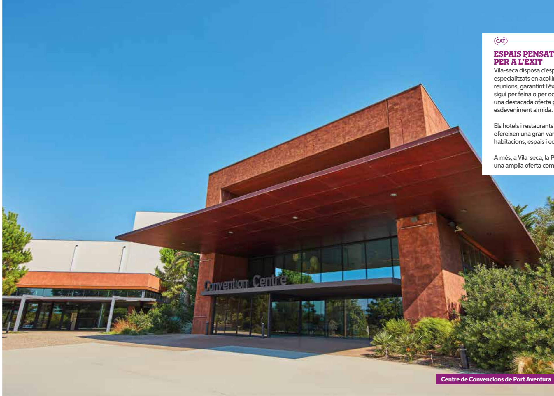
Centre de Convencions de Port Aventura