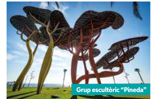
Grup escultòric "Pineda"

Els territoris de Salou, Vila-seca del Comú i Vila-seca de Solcina estaven delimitats per la Creu de la Beguda, la més coneguda de Vila-seca i últim vestigi de les creus del terme, situada avui en dia al Raval de la Mar.