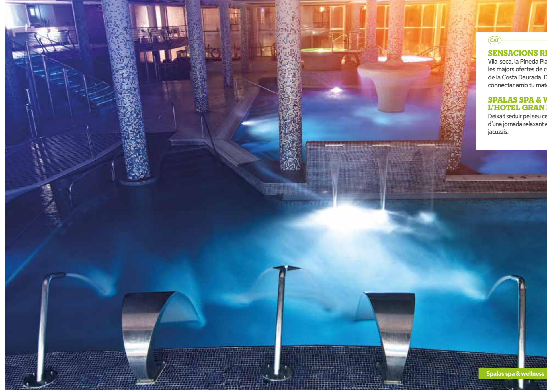
Spalas spa & wellness

Bien-être et sensations relaxantes uniques