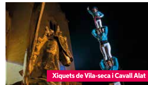
Xiquets de Vila-seca i Cavall Alat