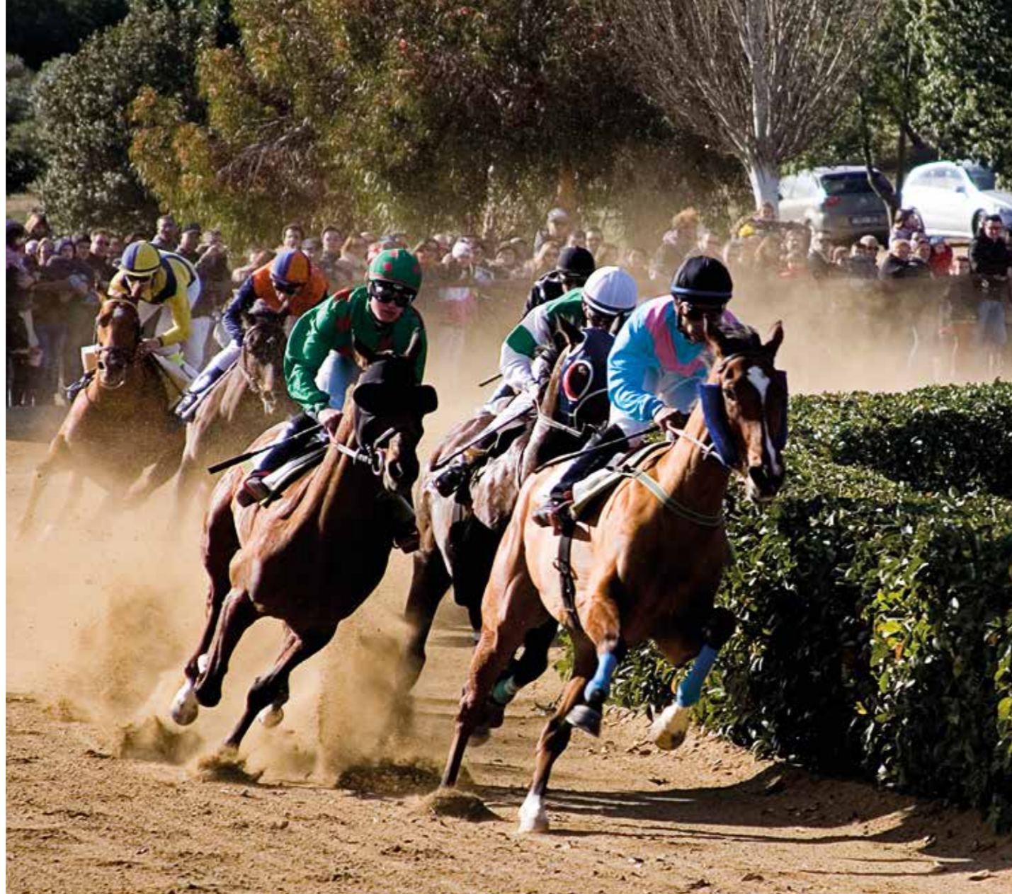
Cós de Sant Antoni