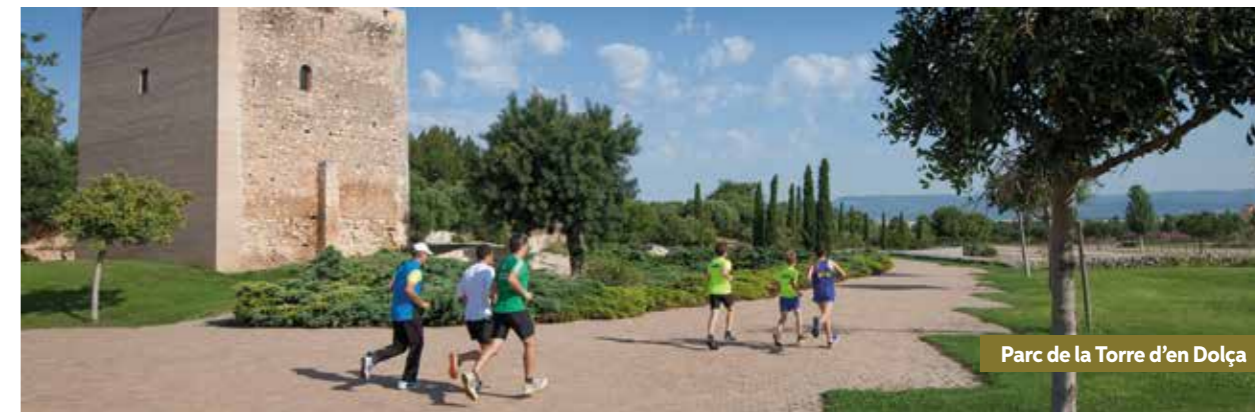
Parc de la Torre d'en Dolça

Vila-seca vous offre la possibilité de faire du sport en plein air, sur la plage de la Pineda dans le Club Sportif, en prêtant gratuitement du matériel et des activités dirigées chaque jour. Vous y trouverez également une installation de street working callisthénie