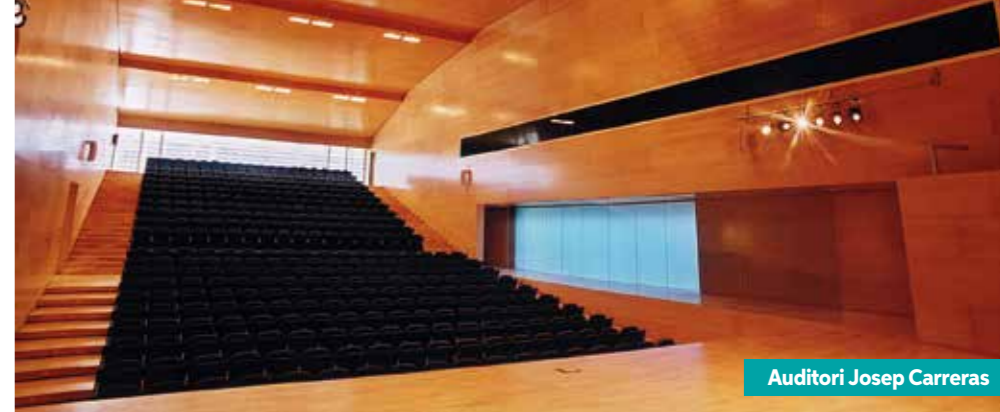
Auditori Josep Carreras