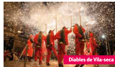
Diablers de Vila-seca

Vila-seca accueille les fêtes de Noël avec une programmation très variée. Le 5 janvier, le jour le plus attendu par les enfants de la ville, on souhaite la bienvenue à Ses Majestés les Rois Mages d'Orient au Château de Vila-seca avec un spectacle de son et lumière puis parcourt les rues à cheval.