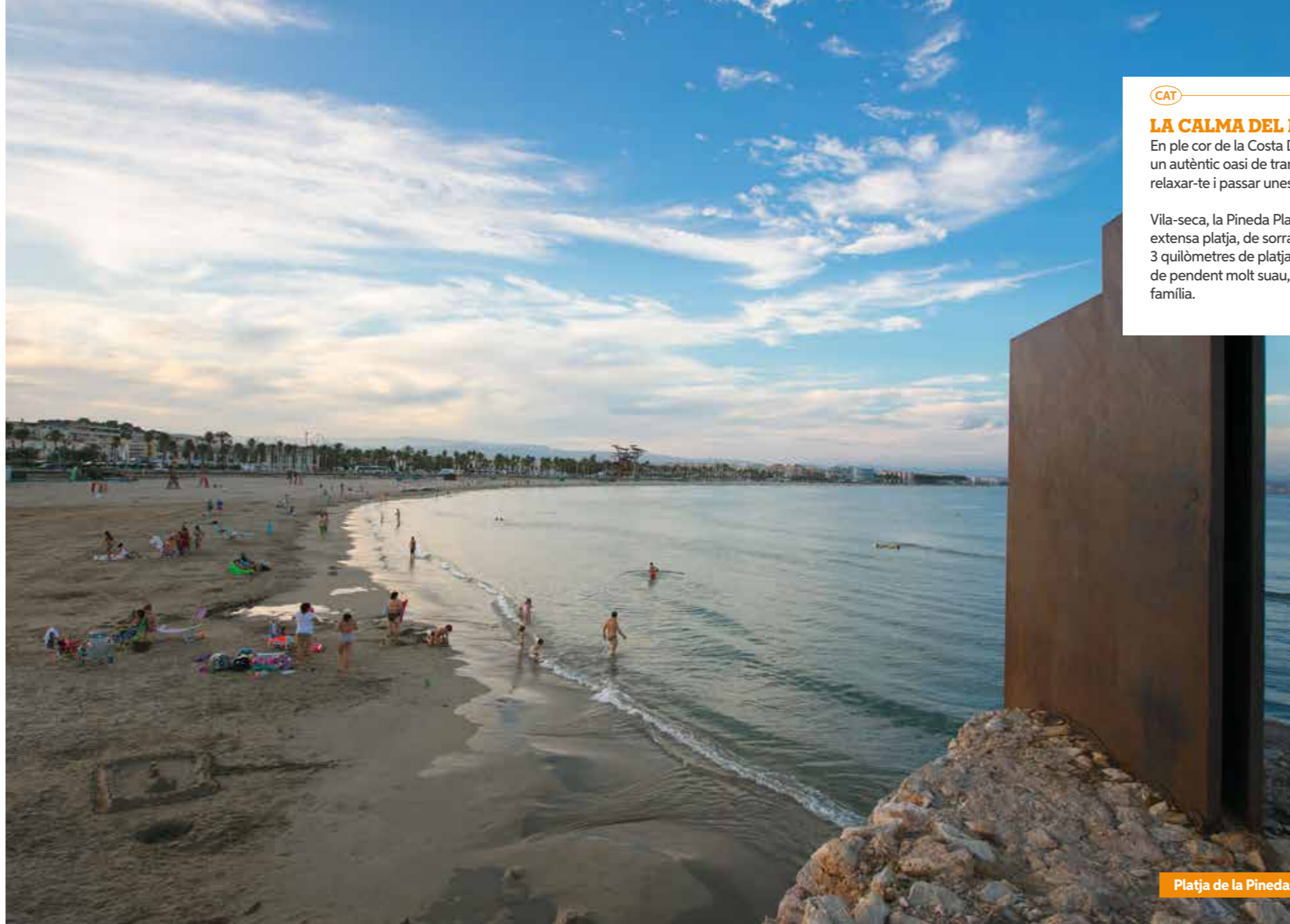
Platja de la Pineda