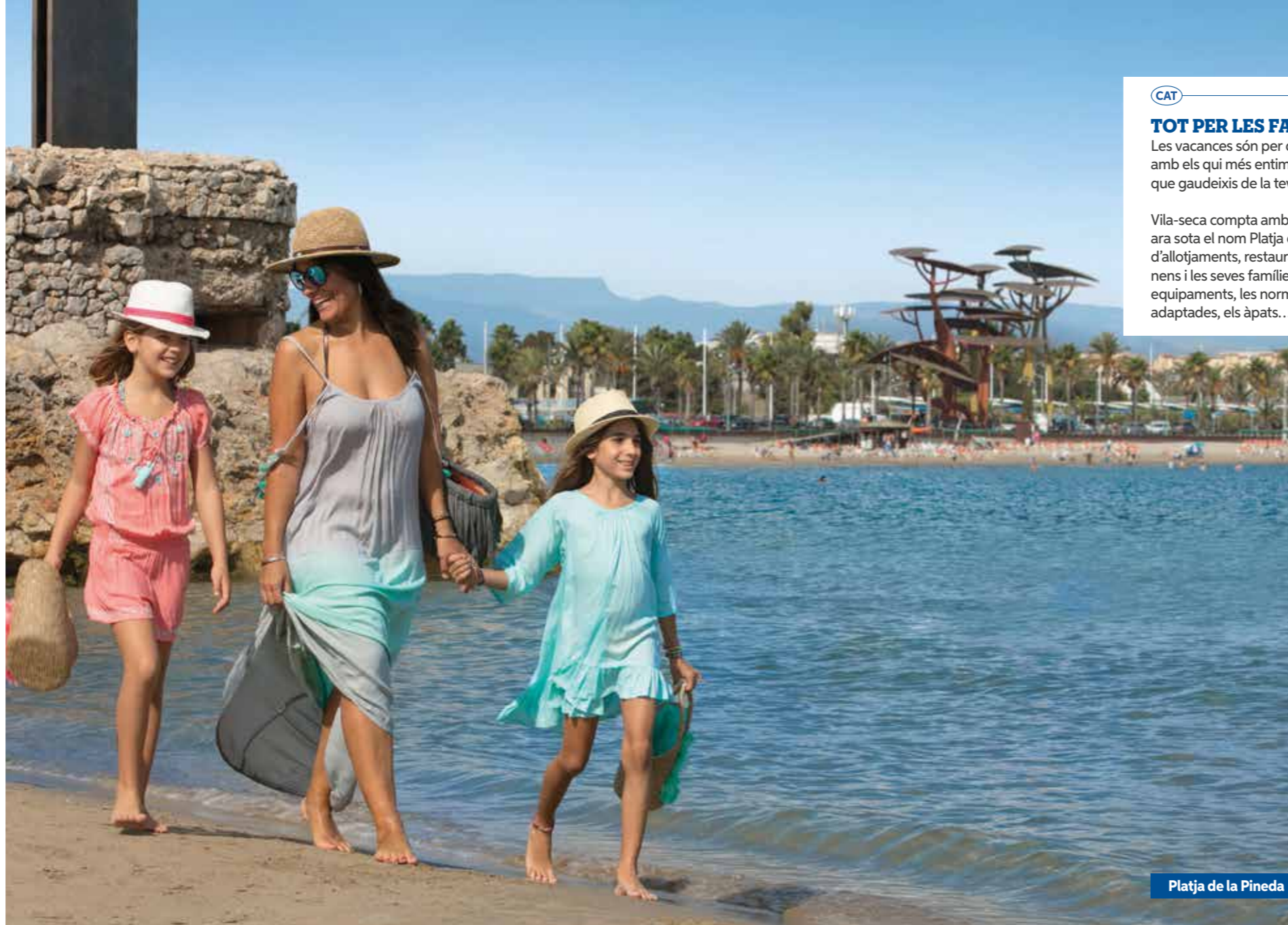
Platja de la Pineda

Familles, vacances avec qui tu aimes le plus