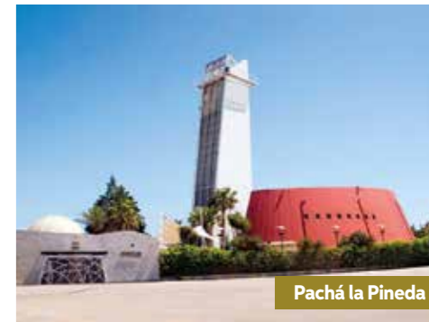
Pachá la Pineda

Tant si vols prendre una copa tranquil·lament, com si vols ballar els ritmes del moment, trobaràs diferents espais d'oci: xiringuitos a peu de platja i la discoteca Pachá la Pineda, una de les més emblemàtiques de la Costa Daurada.