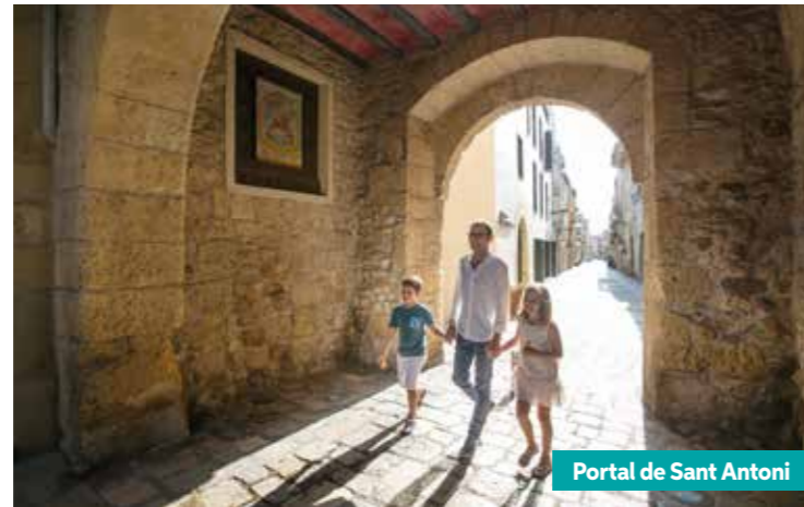
Portal de Sant Antoni

L'Auditori Josep Carreras és un dels equipaments culturals principals de Vila-seca i un dels referents musicals més importants del sud de Catalunya. Annex al Conservatori de Música manté dues programacions estables durant, temporada de primavera i temporada d'hivern. Tant la seva il·luminació, com els equips de so