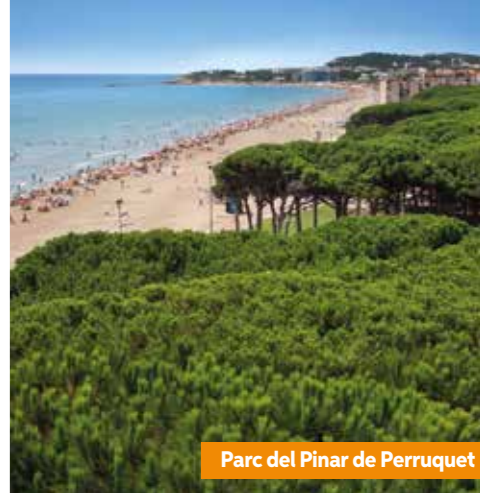
Parc del Pinar de Perruquet

octroyé par l'Associació d'Educació Ambiental i del Consumidor (ADEAC – l'Association d'éducation environnementale et du consommateur).